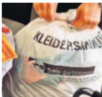
Die Säcke werden in diesen Tagen verteilt.

Die Sammlung im Unterland findet vom 1. bis 3. Februar statt. Tdh bittet die Spenderinnen und Spender, die Kleidersäcke aus Diebstahlgründen erst am aufgedruckten Sammeltag, möglichst vor 8.30 Uhr, gut sichtbar an die Strasse zu stellen. Infos: www.tdh.ch . (red)