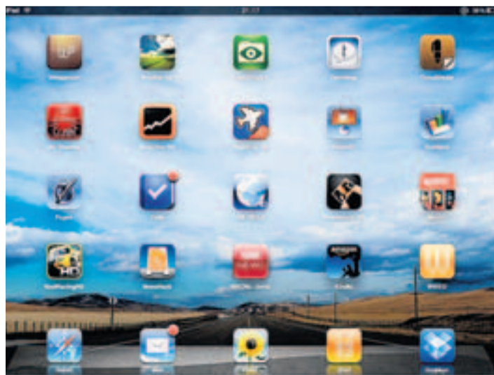
Im März erfahren die Apps-Downloads einen neuen Schub.

Wie beliebt Apps auf iPhone und Co. heute sind, zeigt ein historischer Vergleich. Gab es noch Ende 2008 nur etwa zehn Downloads pro iOS-Gerät, ist diese Zahl mittlerweile auf über 60 gestiegen. Für Apple positiv sei, dass damit eine sehr hohe Kundenbindung einhergehe. Für die Konsumenten könne aber genau das teuer werden, warnt Dediu. (red)