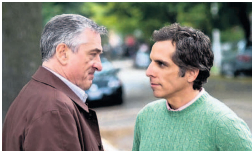
Eindringling Ben Stiller mit «Schwiegervater» Robert De Niro in der Komödie «Meet the Fockers».